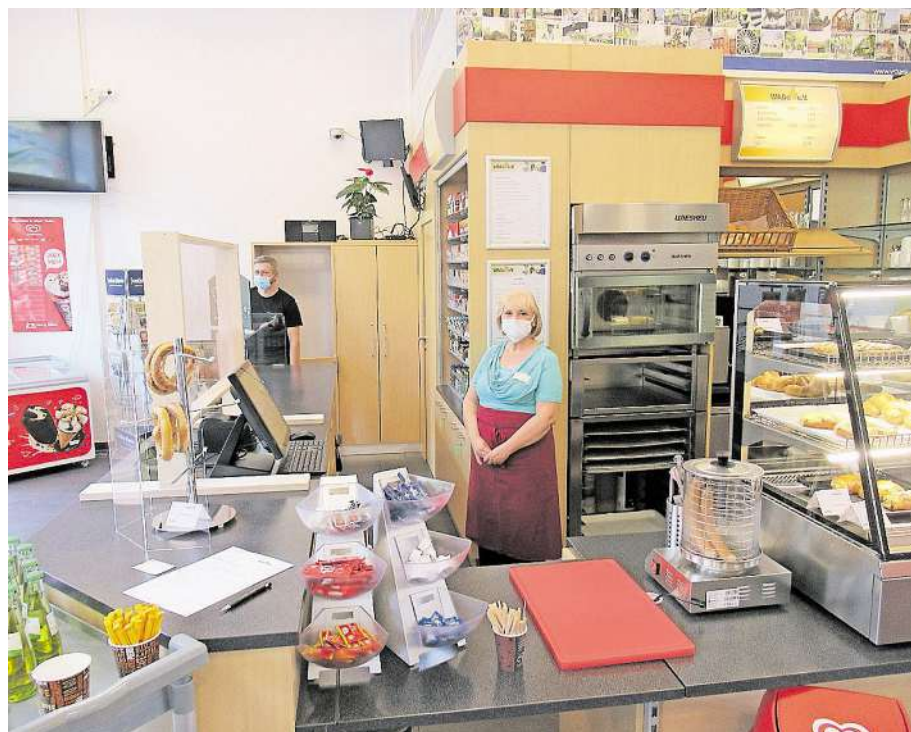
Mit dem neuen WABe-Kiosk wird auch die Aufenthaltsqualität am Stolberger Bahnhof spürbar angehoben.

Eine kleine Spitze in Richtung der Deutschen Bahn können sich die Anwesenden bei der Eröffnung aber nicht verneifen. Einer der Aufzüge des neuen Skywalks ist nach dem Einbau im April bereits defekt, laut Bahn soll er im Juni repariert werden. „Die Stadt Stolberg bleibt dran, damit der Aufzug möglichst schnell wieder fährt und der Bahnhof damit endlich dauerhaft komplett barrierefrei ist“, versichert man in der Kupferstadt. (red)