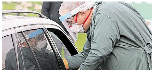
Corona-Abstrich am Auto: Das ist auch in Jülich täglich möglich.

montags bis samstags von 7 bis 19 Uhr sowie sonntags von 8 bis 17 Uhr geöffnet. Termine und Infos: www.autoschnelltest.de . (red)